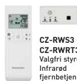
CZ-RWS3 + CZ-RWRT3 Valgfri styreenhed. Infrarød fjernbetjening.