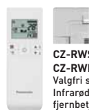
CZ-RWS3 + CZ-RWRU3W Valgfri styreenhed. Infrarød fjernbetjening.